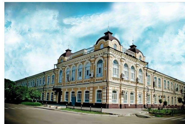
Реализация программы «Доступная среда» в ФГБОУ ВО «Армавирский государственный педагогический университет»

Специалист по социально-психологическому сопровождению студентов Скиба Н.В. Ул. Полины Осипенко, 83/1, 2 этаж. Кабинет психолога. Запись на консультацию: 8(86137) 4- 01-71